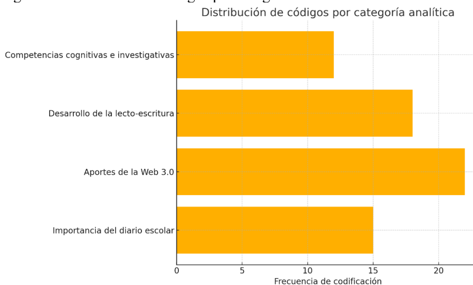
Figura 2. Distribución de códigos por categoría analítica.

Los datos fueron analizados utilizando codificación temática según los pasos propuestos por Braun y Clarke (2006). Además, se realizó una triangulación de fuentes para lograr una interpretación más sólida y confiable de los hallazgos, como se ilustra en la figura a continuación.